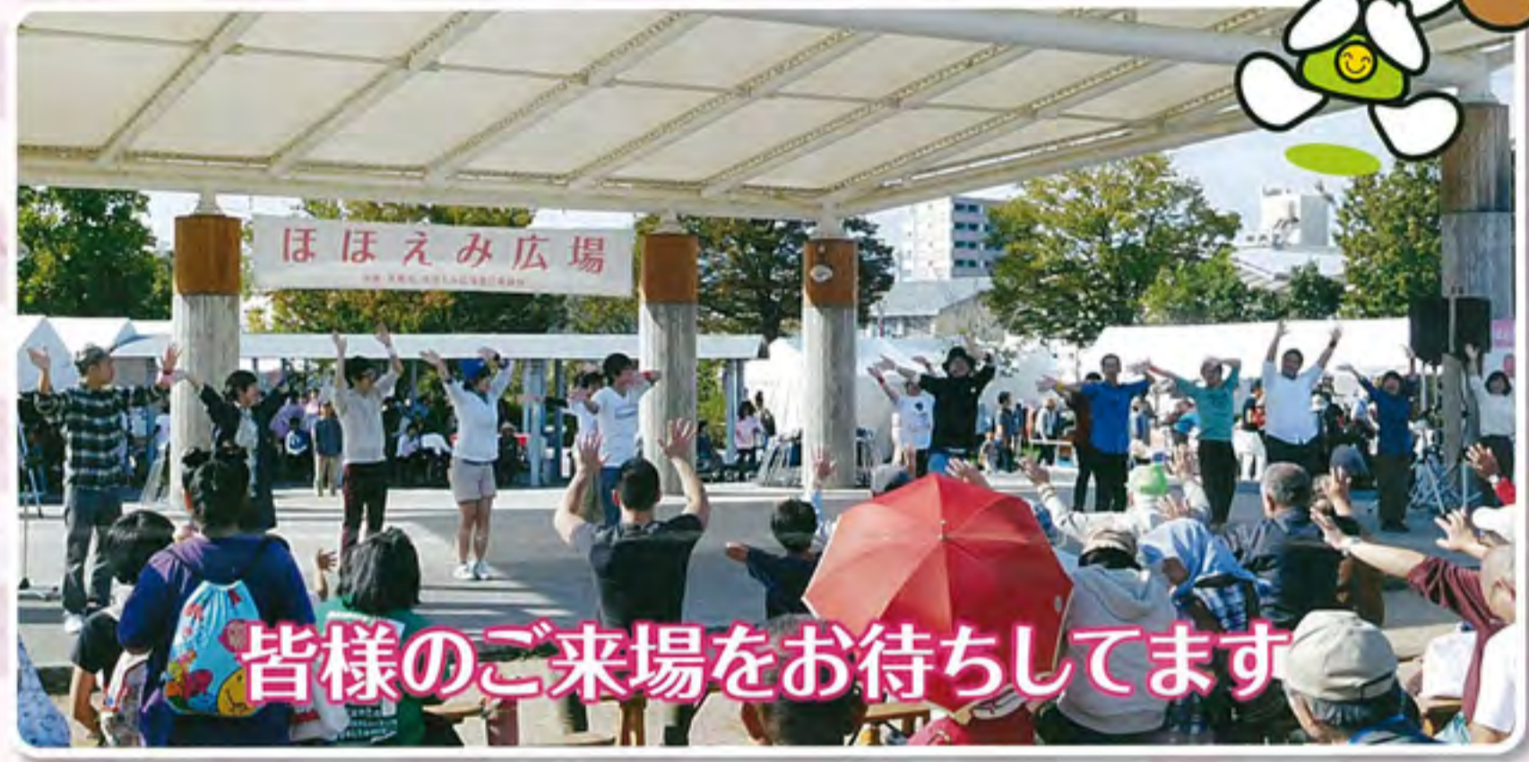
皆様のご来場をお待ちしています