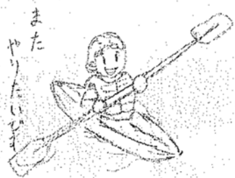
また やりたいです

お世話になりました。初めて参 加させていただきました。初め の参加させてもらったのですが、 楽しく過ごさせていただきました。 いろいろな種目に参加 ができてよかったです。支援学 校を卒業しても、また、このよ うな体験させていただけると ありがたいです。よろしく願 います。