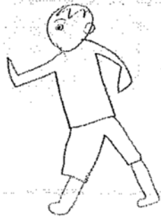
京都市立北総合支援学校 3年 大里昇平

ぼくは、200mや、50m、1 00mや400mも走りました。 少ししんどかったです。立幅 跳びや走り幅跳びをがんばり ました。少しきびしかったです。 ピンバックやソフトボール、ジ ベリックスローを投げることを がんばりました。物を遠くま で投げることができてよかつた です。記録証をもらうことが できてよかったです。