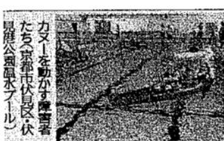
カヌーを動かす障害者 たち(京都市伏見区伏 見港公園温水プール)