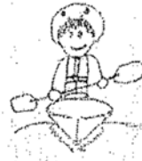
カヌーが一番楽しかったです またやりたいです