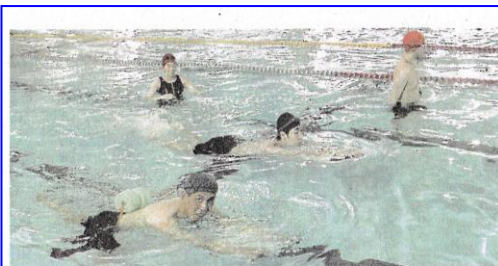
真冬でも！月に1度のプール満喫 伏見で障がい者のつどい

障害のある人に水泳に親しんでもらう「障がい者水泳のつどい」がこのほど、京都市伏見区葭島金井戸町の府立伏見港公園温水プールで開かれた。今年は東京パラリンピックの開催もあり、参加者らは熱心に練習